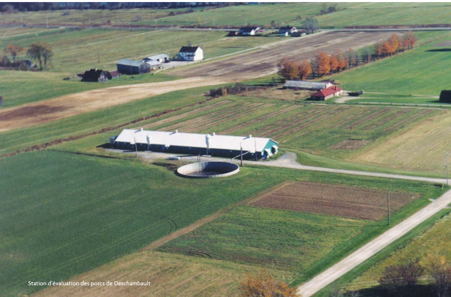
Station d'évaluation des porcs de Deschambault

Des différences de performances significatives ont été observées sur tous les plans, que ce soit pour les performances zootechniques, la qualité de